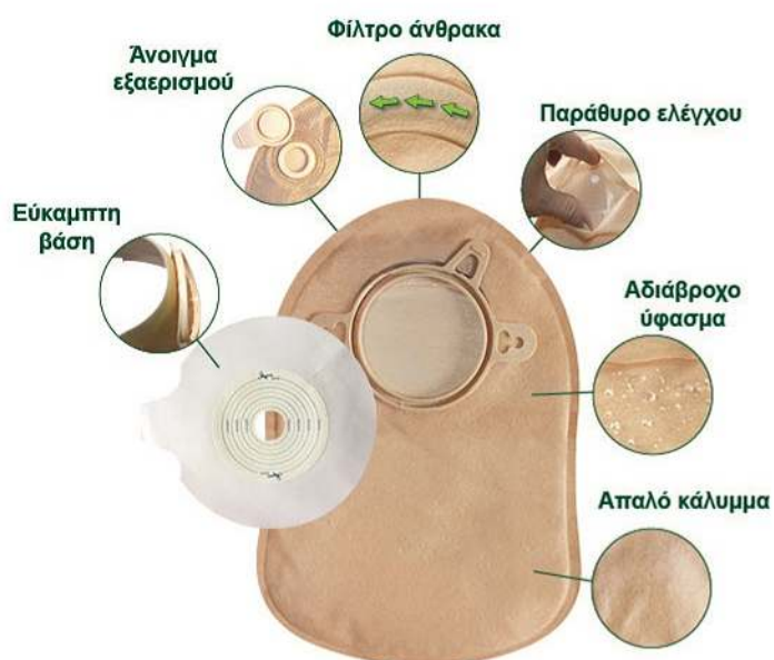
Βάσεις και σάκοι κολοστομίας

Βάσεις και σάκοι ειλεοστομίας με πλαστικό κλείστρο ή με κλείσιμο τύπου Velcro