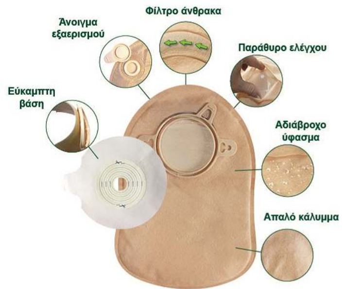
Βάσεις και σάκοι κολοστομίας

Βάσεις και σάκοι ειλεοστομίας με πλαστικό κλείστρο ή με κλείσιμο τύπου Velcro